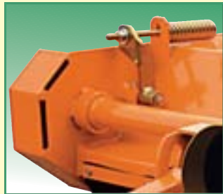
Tendicinghie automatico. Automatic belt tighteners. Tendeur pour courroies automatique. Automatischen Riemenspannern. Estiracorreas automático.