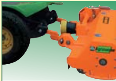
Attacco a due punti. Two-point-hitch. Attelage à deux points. Zwei-Punkt-Anbau. Conexión a dos puntas.