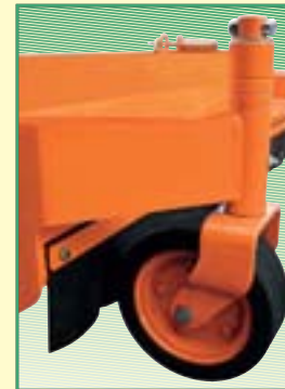
Ruote anteriori pivotanti. Front pivoting wheels. Roues avant pivotantes. Frontpivoträder. Ruedas delanteras pivotantes.